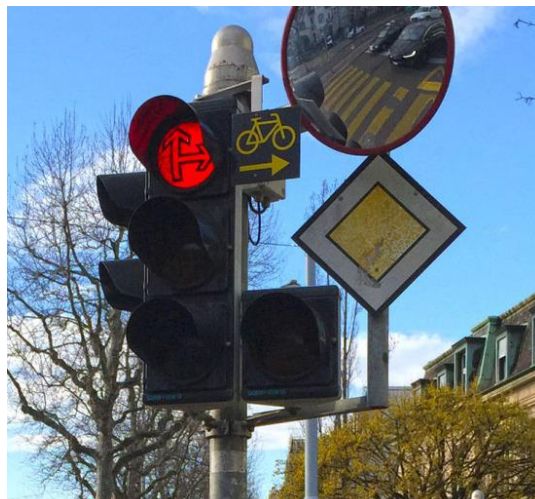
Abbildung 1: Signalisation für Freies Rechtsabbiegen bei Rot

Das Freie Rechtsabbiegen bei Rot für Velofahrende wurde mit der Anpassung der Signalisationsverordnung, welche am 1. Januar 2021 in Kraft trat, legalisiert. Das Regime für während eines mehrjährigen Pilotversuchs in Basel getestet und als erfolgreich befunden. Das freie Rechtsabbiegen bei Rot kann mittels einer einfachen Signalisation an den Ampelpfosten eingerichtet werden. Ist neben dem roten Licht das Signal «Rechtsabbiegen für Radfahrer gestattet» angebracht, dürfen Velos bei Rot nach rechts abbiegen, haben aber gegenüber den querenden Fussgängerinnen und Fussgängern weiterhin keinen Vortritt.